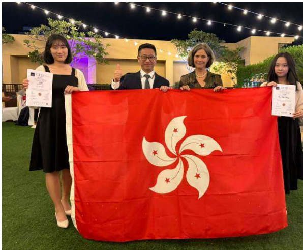
GTPP 國際專題研習大獎 2023(杜拜領獎)