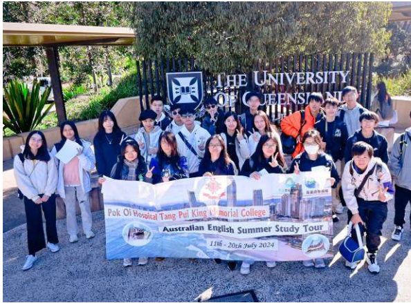
暑期澳洲英語遊學團

為幫助學生在學業及身心健康得到均衡發展，維持健康的生活方式，學校讓學生參與 50 多個學校校隊、學會訓練、義工隊服務以及多項校外比賽等。除了校內社際比賽、本學年更安排學生參加多個交流考察團，讓學生寓學習於旅遊，不但可增廣見聞，同時學習書本外的知識。