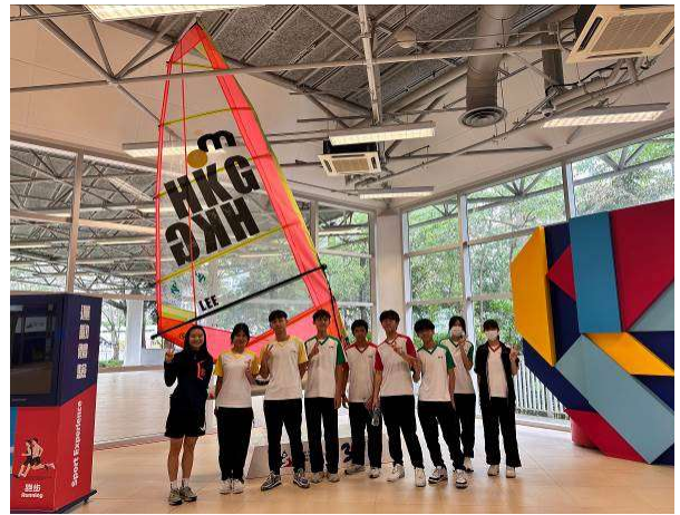
參觀香港體育學院