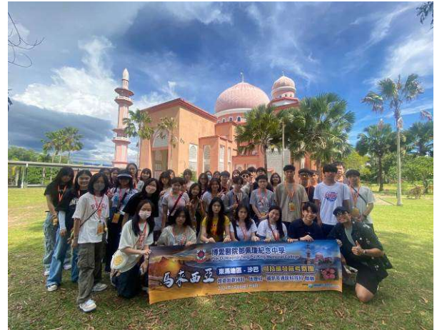
馬來西亞（東馬地區）可持續發展考察團