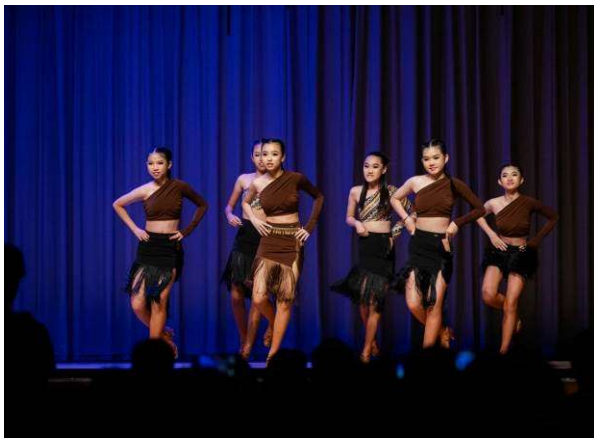
《才華盡展繽紛夜》才藝表演晚會