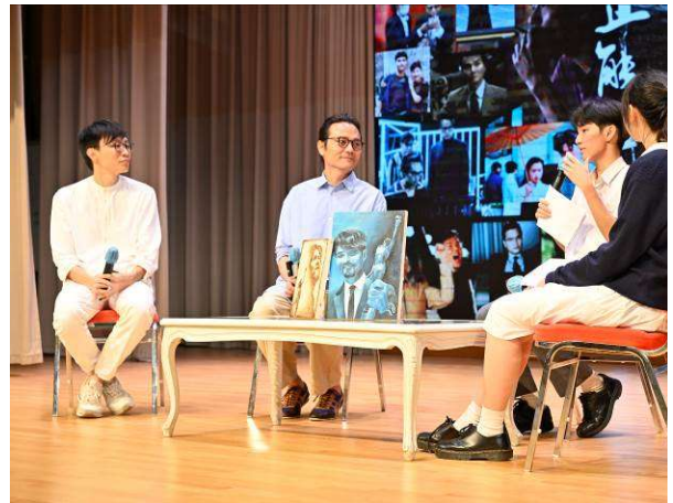
OLE 嘉賓-著名演員林家棟