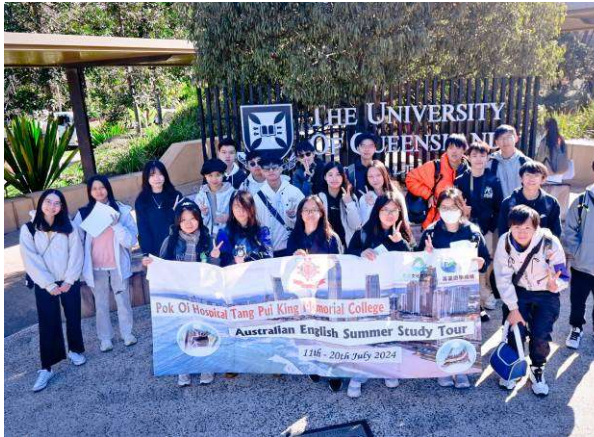
暑期澳洲英語遊學團

為幫助學生在學業及身心健康得到均衡發展，維持健康的生活方式，學校讓學生參與 50 多個學校校隊、學會訓練、義工隊服務以及多項校外比賽等。除了校內社際比賽、本學年更安排學生參加多個交流考察團，讓學生寓學習於旅遊，不但可增廣見聞，同時學習書本外的知識。